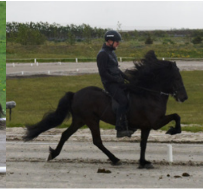
Hjör von Vellir