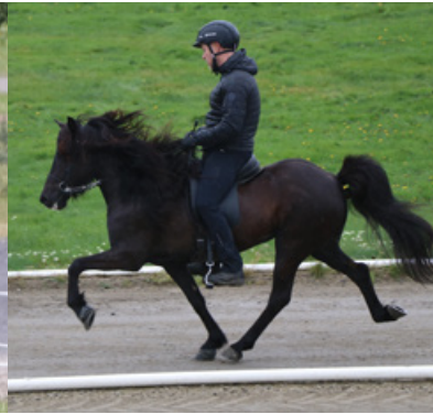
Sinfónía von Vellir