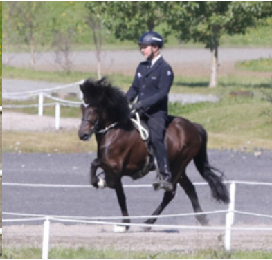
Vallarsól von Vellir