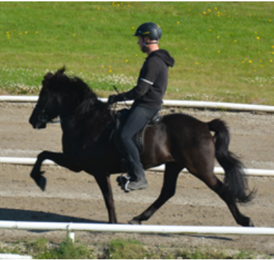
Sónata von Vellir

Trainer: Ida Thorborg. Reiter: Jakob Svavar Sigurðsson