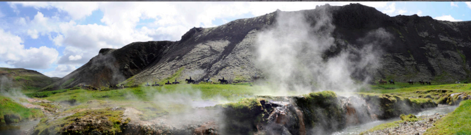
The Valley Reykjadalur – A Hidden Paradise!