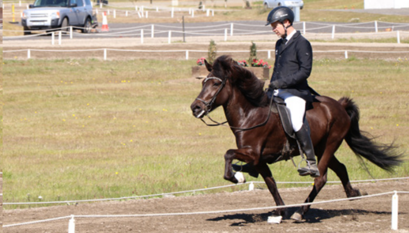
Vallarsól IS2013287086 von Vellir