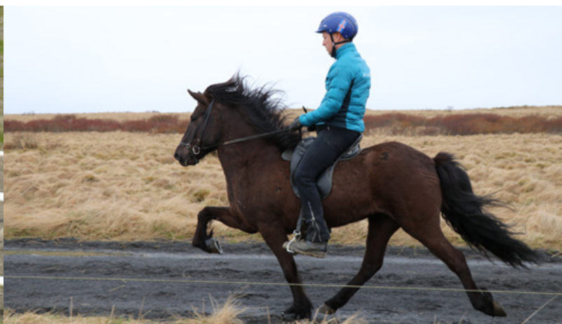
Hjör IS2014287075 von Vellir