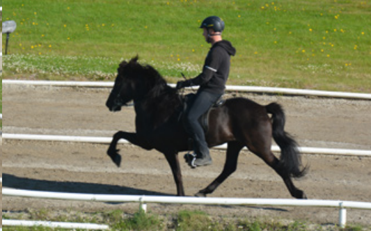
Sónata IS2012287086 von Vellir