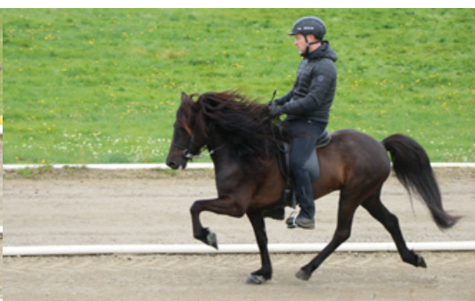
Sinfónía IS2013287087 von Vellir