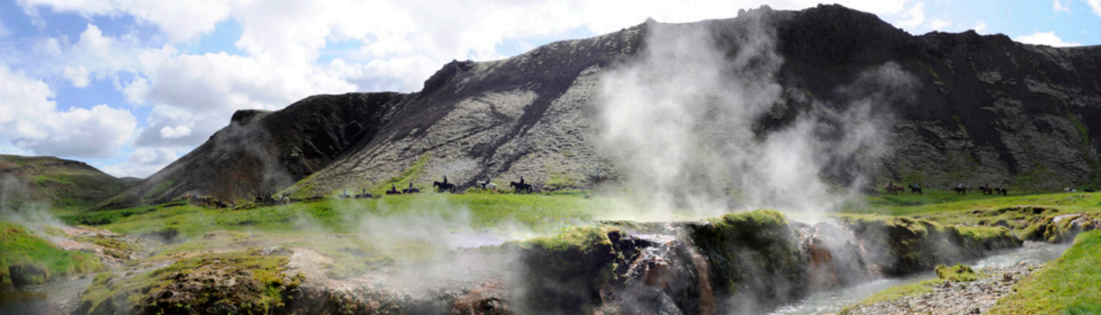
The Valley Reykjadalur – A Hidden Paradise!