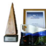
Im Jahre 2011 wurde Hotel Eldhestar der Umweltpreis des isländischen Fremdenverkehrsamtes sowie der Gemeinde Ölfus verliehen.