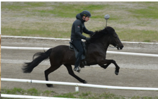
Vallarsól IS2013287086 von Vellir