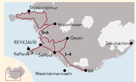
Silvester auf dem Land (8 Tage)

Fahrt zum Flughafen und Rückflug. (ca. 5 km)